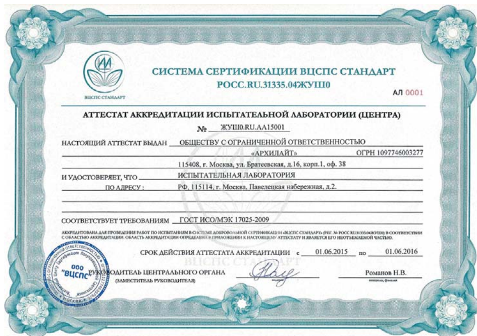
Рисунок. Знак Системы и Аттестат аккредитации лаборатории (центра) в Системе добровольной сертификации «ВЦСПС СТАНДАРТ»